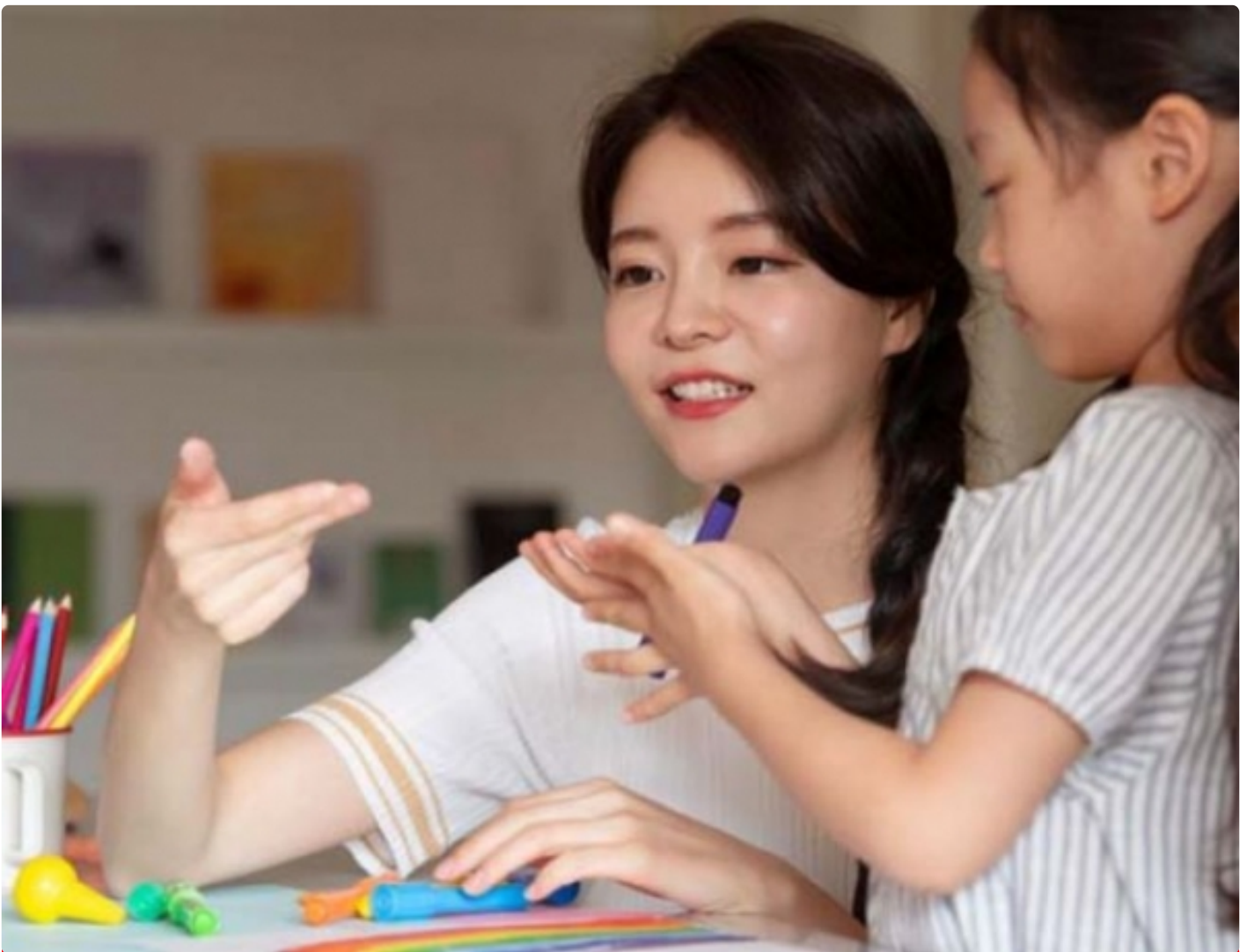
Ilustrasi: Pengasuhan anak